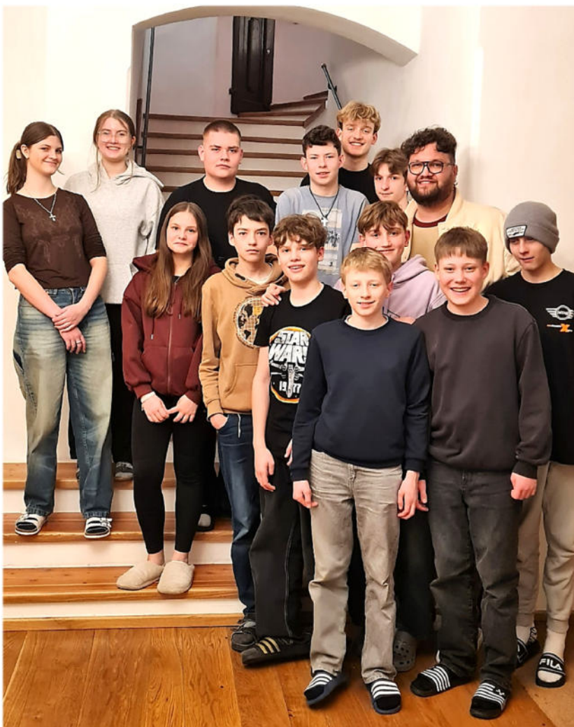
Unsere Konfis und das Mitarbeiterteam. Gemeinsam unterwegs im Glauben.