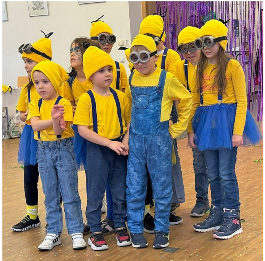
Die Siebenbürger „Mini(on)s“ warten auf ihren Einsatz.

Zur Eröffnung marschierte eine Abordnung der Kindergarde der Trauner Faschingsgilde ein und zeigte